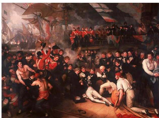
Рис. 4. The Death of Nelson . Benjamin West. 1806 3