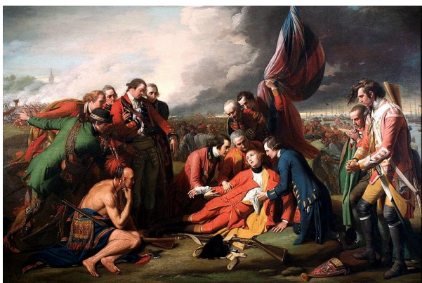
Рис. 2. The Death of General Wolfe . Benjamin West. 1770 1