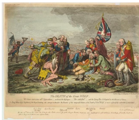
Рис. 3. The Death of the Great Wolfe . James Gillray. 17.12.1795 2