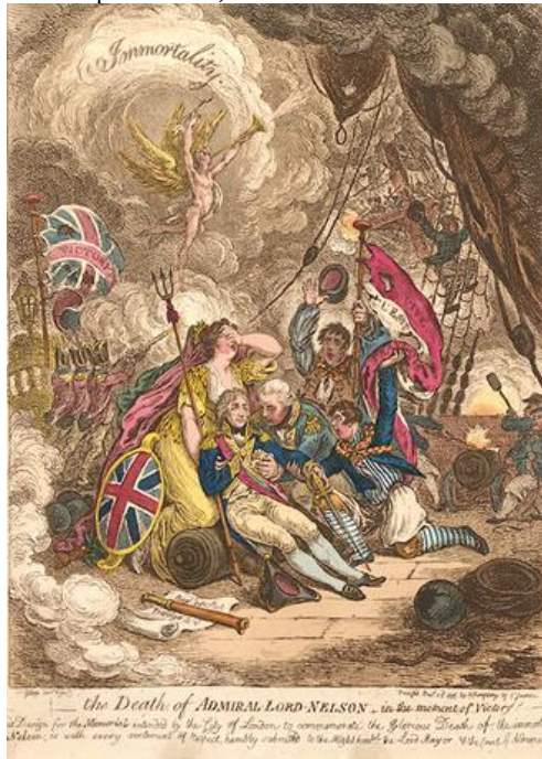
Рис. 1. The Death of Admiral Lord Nelson – in the moment of Victory. James Gillray. 23.12.1805 1

это аллегория того, что даже Князь Тьмы и противник оплакивали смерть Нельсона.