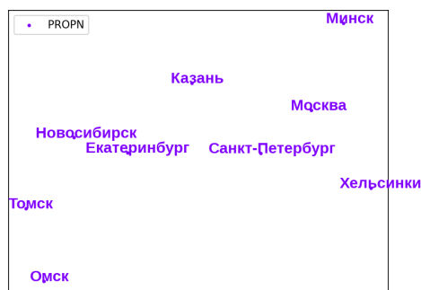
Диаграмма 3. Семантическое пространство существительных – названий городов (по данным https://rusvectors.org ; Корпус GeoWAC (2.1 млрд слов), модель fastText)

из огромного массива данных и помещают лексемы в многомерное семантическое пространство. Разные модели отличаются разными подходами к обработке контекста, к оптимизации семантических пространств и некоторыми другими параметрами, но суть их остается неизменной: созданный алгоритм без участия исследователя анализирует корпусные данные и классифицирует найденные единицы; чем чаще слова встречаются в одинаковых контекстах, тем семантически ближе они друг к другу. Диаграмма 3 ниже показывает взаимное расположение некоторых городов России, Беларуси и Финляндии в семантическом пространстве, как оно представлено в русскоязычном интернет-корпусе объемом в 2,1 миллиарда слов. Как кажется, эта диаграмма соответствует реальности – как минимум в контексте лингвистических связей между этими городами.